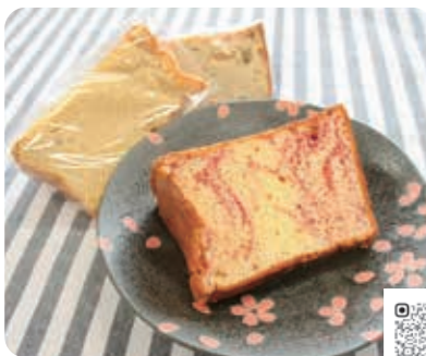
米粉を使ったシフォンケーキ。手前は「ラズベリーヨーグルト」

南魚沼市六日町456-22 営業日/火・木・土その他不定休 営業時間/12時~16時30分 (売り切れ次第終了)