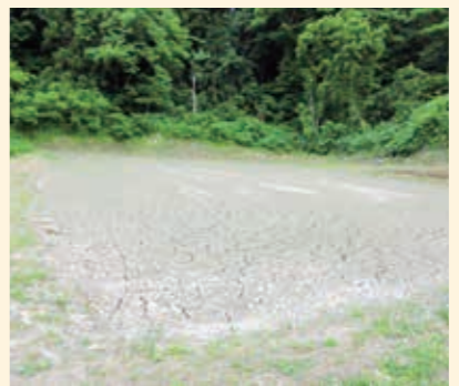
水不足により移植不能の水稻圃場

農作物共済（水稻・麦） 水稻は、移植期の用水不足による移植不能が県内各地で発生し、被害面積は約60haに及びました。また、8月下旬の風雨による倒伏、その後の断続的な降雨により倒伏が進み、生育及び登熟が阻害され減収となりました。