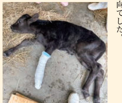
骨折により治療中の子牛

家畜共済 死傷事故では、乳用牛の運動器・循環器・消化器疾患、肉用牛の新生子疾患や循環器疾患が多く発生しました。病傷事故では、乳用牛の生殖器・泌尿器、肉用牛の呼吸器病等が多く発生し、いずれも例年と同様の傾向でした。