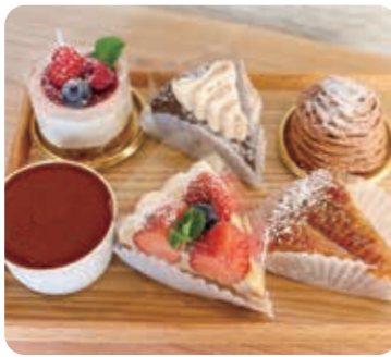
地元産の米や野菜、果物などをたっぷり使用したスイーツ