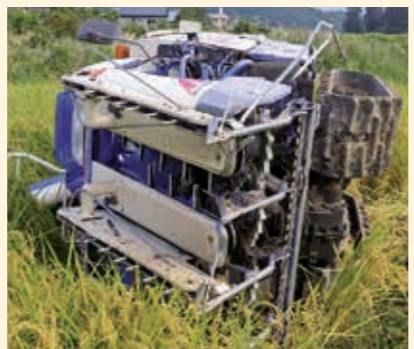
目測を誤り農道から転落したコンバイン

農機具共済 事故台数、支払共済金ともに昨年同期より増加しました。特に、接触・衝突事故は100台以上の増加となりました。また、物価高の影響により、農業機械や部品価格が高騰し、修理費用も高額となる傾向がありました。