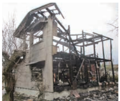
火災により全焼した農作業場

建物共済 令和6年能登半島地震の影響により、4月以降も4億円を超える支払いがありました。また、落雷は前年同期と比べて被害棟数が減少しましたが、火災や車両の衝突等による事故は多く発生しました。