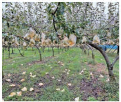
セイヨウナシ褐色斑点病による落果被害

果樹共済 収穫共済は、5月、7月の降雨により、ぶどう・なし・かきに被害が発生しました。特になしでは、セイヨウナシ褐色斑点病が多発生し、甚大な被害となりました。樹体共済では、病害により樹木が枯死する被害が発生しました。