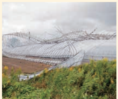
強風により骨組みまで吹き飛ばされたハウス

園芸施設共済 5月17日の強風など、風害による施設本体および被覆物の被害が多く発生し、全体の8割を占めました。また、その他として、車両等が接触したことによる施設本体の被害や落雷による付帯施設の被害も発生しました。